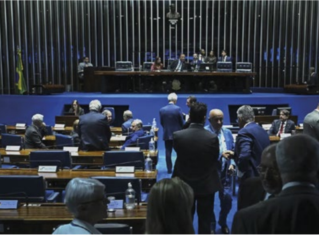
Antes, a previsão era que o Senado votasse nesta terça-feira um requerimento para acelerar a tramitação da proposta

O Senado adiou para a próxima semana a análise do projeto que aumenta para 531 o número de deputados federais. A decisão foi comunicada nesta terça-feira (17) pelo presidente da Casa, Davi Alcolumbre. Segundo ele, vários senadores pediram mais tempo para se aprofundarem sobre o tema. Os parlamentares também argumentaram que o texto não deveria ser votado às vésperas de um feriado prolongado. Antes, a previsão era que o Senado votasse nesta terça-feira um requerimento para acelerar a tramitação da proposta. A sessão do Congresso para votação de vetos, porém, atrasou a abertura da sessão do Senado, e Alcolumbre interrompeu a sessão. O texto que aumenta de 513 para 531 o número de deputados é defendido pela Câmara, mas encontra resistência em bancadas do Senado, por conta da elevação dos gastos públicos com o Congresso.